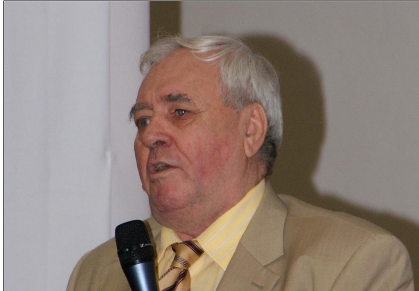
3. kép. Előadóként a Felderítők Társasága Egyesület katonadiplomáciával kapcsolatos szakmai konferenciáján (2013)