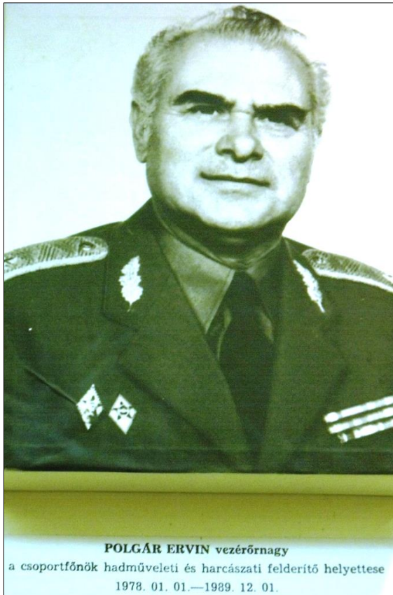
4. kép. Polgár Ervin ny. vezérőrnagy

Vezetésével vált egységessé a csapatfelderítés szakmai irányítása, megszilárdult és a követelményeknek megfelelő szintre fejlődött a szakalegységek és törzsek kiképzési, harckészültségi színvonala.