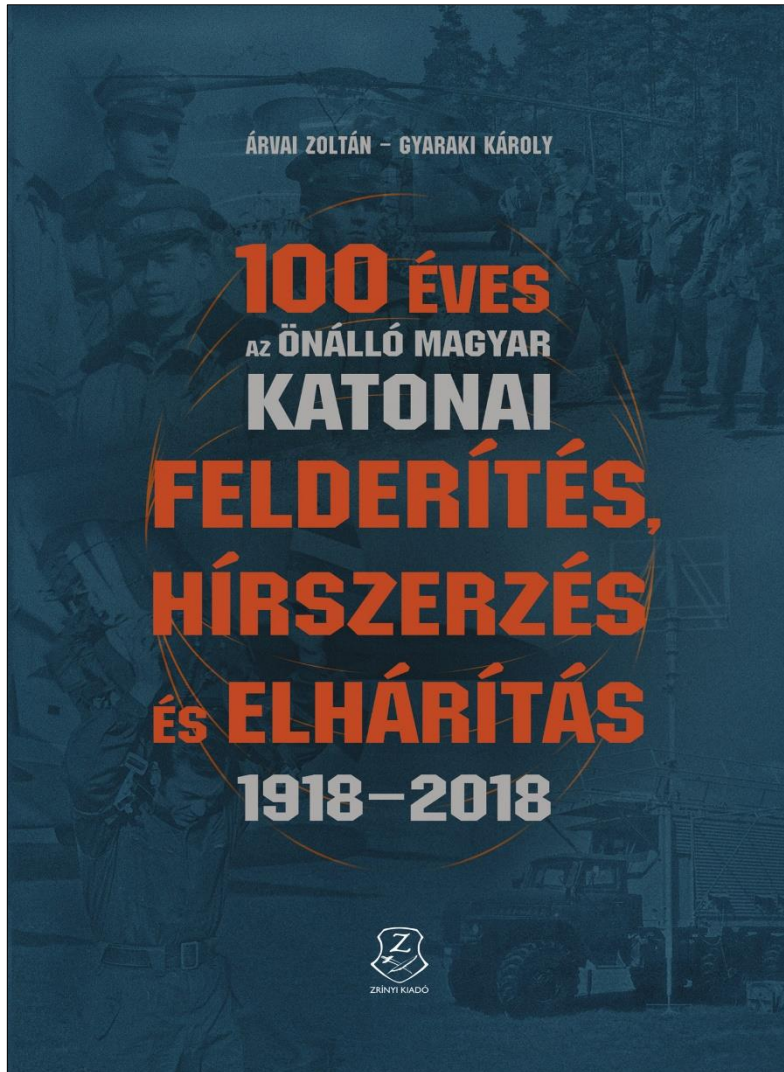
A könyv borítója

A kötet megjelenése kapcsán gratulálunk a szerzőknek tartalmas és igényes munkájukhoz. A könyvet, melynek közreadása szervesen illeszkedik a centenáriumi évforduló eseménysorozatához, szívből ajánljuk Egyesületünk tagjainak elolvasásra és tanulmányozásra.