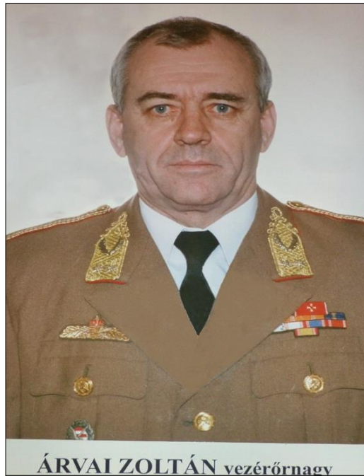
1. kép. Árvai Zoltán ny. vezérőrnagy mb. hivatalvezetőként

2020. január 10-én elhunyt Árvai Zoltán ny. vezérőrnagy, a HVK Katonai Felderítő Hivatal mb. hivatalvezetője, a katonai felderítés és a katonadiplomácia egyik meghatározó személyisége, Egyesületünk Örökös Tiszteletbeli Tagja, korábbi alelnöke.