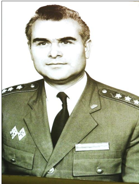
2. kép. Polgár Ervin tábornok ezredeként

Időközben megnősült, családot alapított, a házasságból két lánygyermek született. A család Budapesten telepedett le.