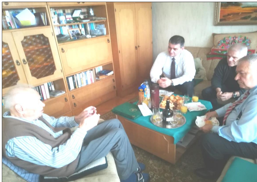
1. kép. Polgár Ervin tábornok úr köszöntése otthonában 90. születésnapján

2019. november 12-én, 90. születésnapján otthonában kerestük fel Polgár Ervin ny. vezérőrnagy urat, a csapatfelderítés (hadműveleti-harcászati felderítés) meghatározó személyiségét, Egyesületünk Örökös Tiszteletbeli Tagját. A jeles nap alkalmából a KNBSZ felderítő csoportfőnöke, a Felderítők Társasága Egyesület elnöke és a felderítő szakma jeles képviselői köszöntötték. Polgár Ervin tábornok úr több mint két évtizedes szakmai vezetői tevékenysége eredményeként az 1980-as években megalapozta és (nemzetközi összehasonlításban is) magas szintre emelte a csapatfelderítést, a későbbi hadműveleti-harcászati felderítés szakterületét.