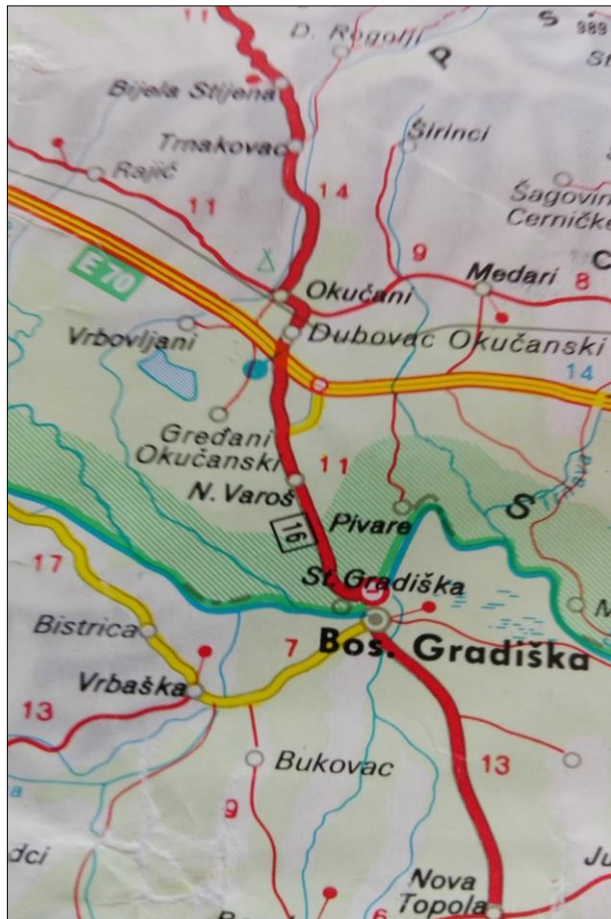
2. kép. Okucsány elhelyezkedése a térképen

Két konvojjal hetente két-három alkalommal szállítottunk Okucsányba. A jó felkészítésnek, valamint a gépjárművezetői állomány fegyelmezett munkájának és áldozatkészségének köszönhetően a szállítások során baleset vagy fegyelemsértés nem történt.