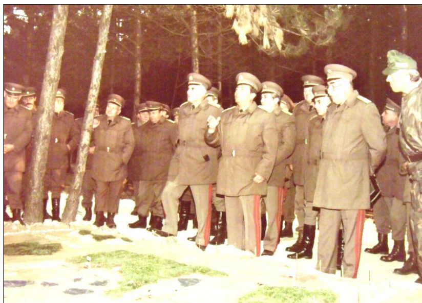
3. kép. Módszertani bemutató 1984-ben

Kezdetben gondot jelentett az egységes felderítőrendszer hiánya, de hatékony együttműködés és szervezőmunka eredményeként – több ország között elsőként – az 1980-as évek elejére ezt a feladatot is sikerült megoldani. A szakmai munkához magas szintű kutató- és tudományos tevékenység is párosult.