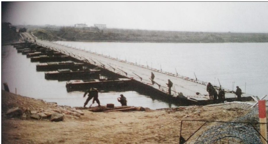
5. kép. A pontonhíd Slavonski Brodnál

Az ünnepségre a Magyar Műszaki Kontingens parancsnoka vezetésével utaztunk. Nem messzire Volinjától a parancsnok értesítést kapott az IFOR hadműveleti ügyeletéről, hogy a Slavonski Brodnál lévő pontonhídnál (melyet a magyar kontingens üzemeltetett) a Száva folyón levonuló árvíz komoly gondokat okoz. Szükségük van olyan angolul tudó tisztre, aki segít a kialakult kritikus helyzet megoldásában. A parancsnoktól azt a feladatot kaptam, hogy azonnal induljak Slavonski Brodba és vegyem fel a kapcsolatot az amerikai műszaki kontingens parancsnokával a kialakult helyzet tisztázása és rendezése érdekében.