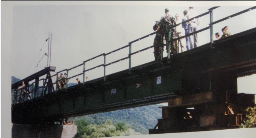
4. kép. A helyreállított híd

Az ünnepségre a Magyar Műszaki Kontingens parancsnoka vezetésével utaztunk. Nem messzire Volinjától a parancsnok értesítést kapott az IFOR hadműveleti ügyeletéről, hogy a Slavonski Brodnál lévő pontonhídnál (melyet a magyar kontingens üzemeltetett) a Száva folyón levonuló árvíz komoly gondokat okoz. Szükségük van olyan angolul tudó tisztre, aki segít a kialakult kritikus helyzet megoldásában. A parancsnoktól azt a feladatot kaptam, hogy azonnal induljak Slavonski Brodba és vegyem fel a kapcsolatot az amerikai műszaki kontingens parancsnokával a kialakult helyzet tisztázása és rendezése érdekében.