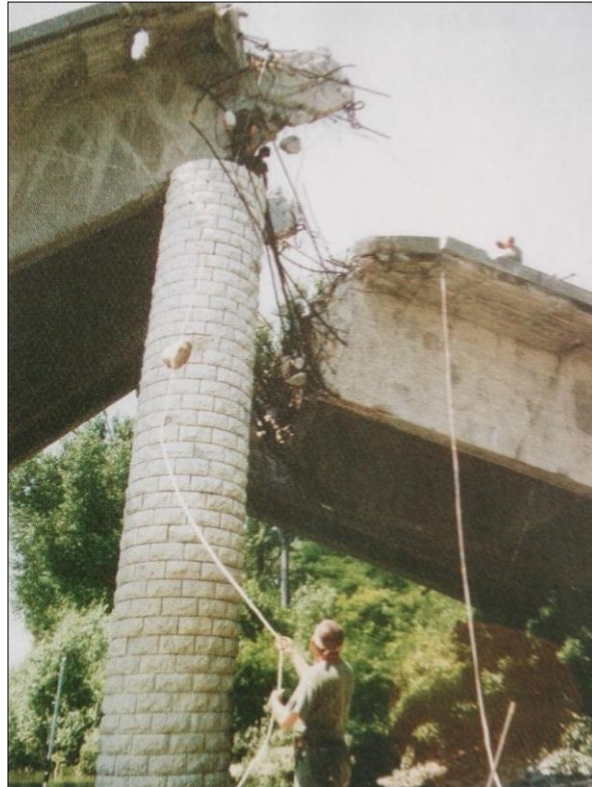
6. kép. A rombolt híd Slavonski Brodnál

1996. július 1. és szeptember 7. között kiemelt fontosságú feladatomat képezte a Slavonski Brodnál rombolt közúti és vasúti híd újjáépítési munkálataiban való részvétel. E feladat során tolmácsolási és összekötő tiszti feladatokat láttam el.