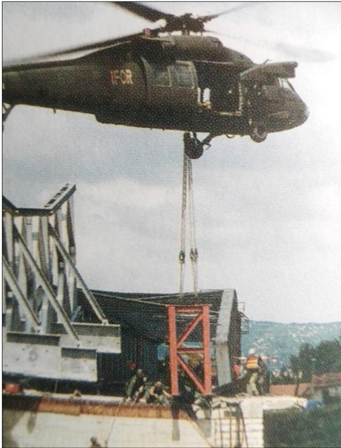
7. kép. A hídelemek beemelése helikopterről

A július végén horvát rendszámú kamionokkal érkezett hídelemeket a szerb hivatalos szervek nem engedték át a pontonhídon a szerb oldalra. Átszállításukat a Magyar Műszaki Kontingens teherjarműveinek kellett elvégezni annak érdekében, hogy megkezdődhessen a híd összeszerelése. A munkálatokat a Mabey & Johnson cég helyszínre érkezett szakértője irányította. A hídelemek behelyezése helikopterről történt. A munka irányításában személyesen is részt vettem.