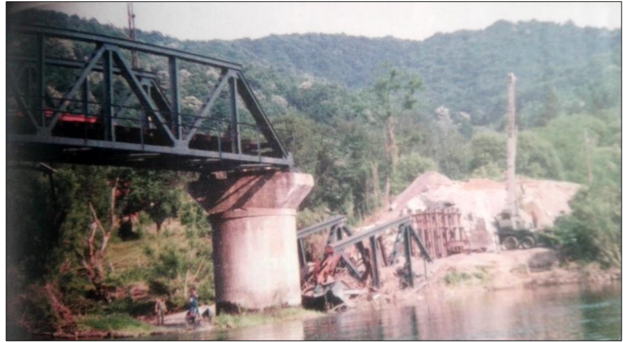
3. kép. A lerombolt volinjai híd

volt nagy jelentőségű, mivel a volinjai vasúti híd rekonstrukciójával megteremtődhetett a feltétele a Bosznia-Hercegovina és Horvátország közötti vasúti közlekedés újraindításának.