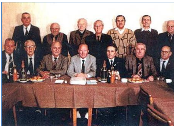
Az első országos elnökségi ülés résztvevői:

Az első találkozón, 1981 novemberében még csak 58 fő vett részt. A találkozók rendszeressé váltak, és 1985-re döntés született arról is, hogy ezeket az önálló ejtőernyős baráti csoportokat egy vezetőség fogja össze, amely a rendezvényeket szervezi és ellátja a szükséges ügyintézői feladatokat. Az 1986. szeptemberi székesfehérvári találkozón már 180 fő vett részt. Ekkor hívták életre az Ejtőernyős Szociális és Kegyeleti Bizottságot, amelynek feladata a nehéz