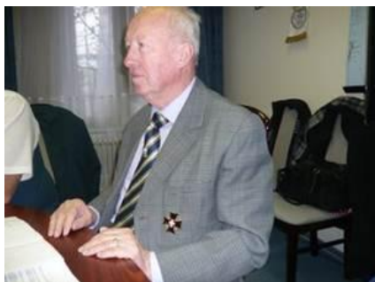
Vadászi Tibor vezérőrnagy, a Szövetség első elnöke